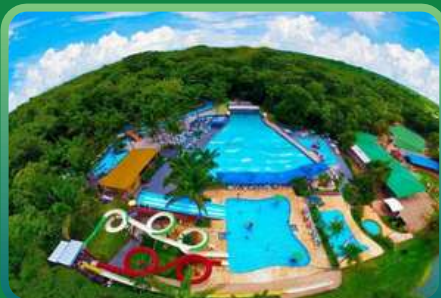
CACOAL SELVA PARK