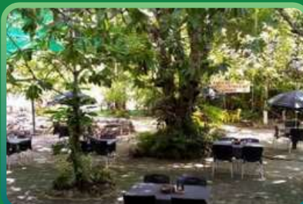
CABANA DO PEIXE