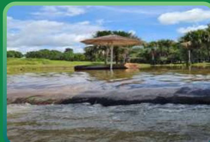
SÍTIO BOLA DE OURO