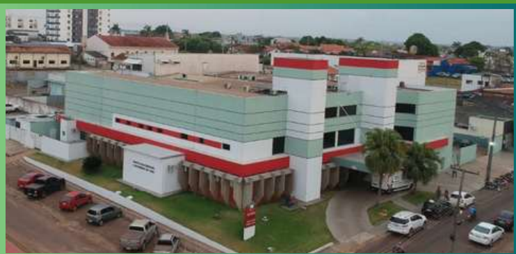
Hospital dos Acidentados