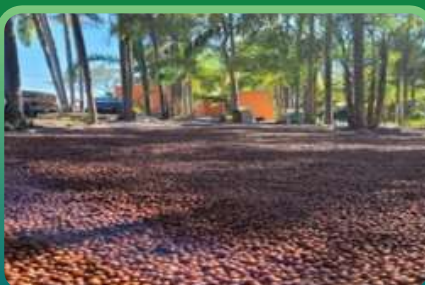
CAFÉ DA LUZ