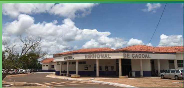
Hospital Regional de Cacoal - HRC