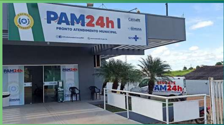
Pronto Atendimento Municipal - PAM