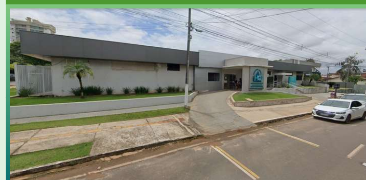
Hospital Geral e Ortopédico - HGO