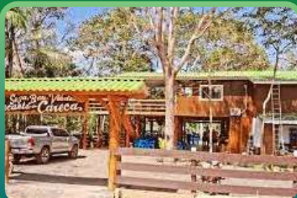
RECANTO DO CARECA