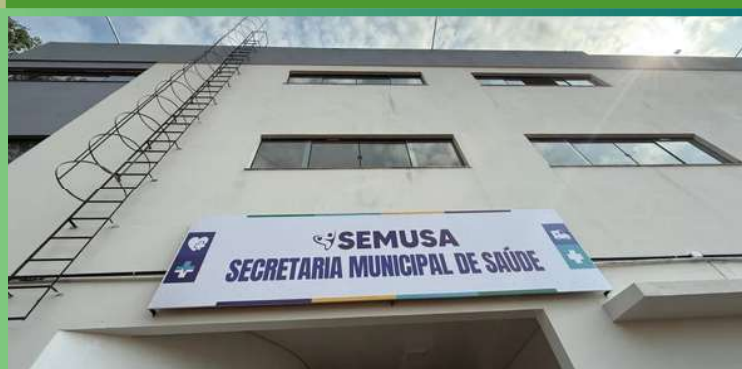
Secretaria Municipal de Saúde - SEMUSA