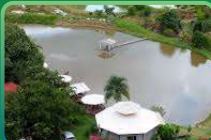
PESQUE PAGUE BELA VISTA