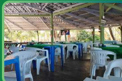
QUIOSQUE DA FAMÍLIA