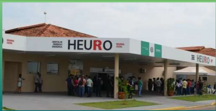
HEURO Hospital de Urgência e Emergência Regional de Cacoal