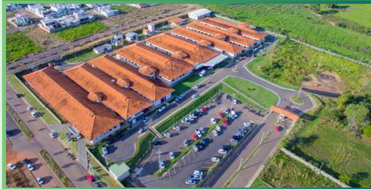
Hospital São Daniel Comboni - Oncologia