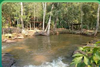
BALNEARIO RECANTO DA NATUREZA