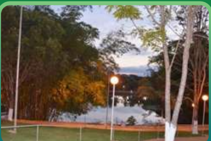
PARQUE SABIÁ - LAGO