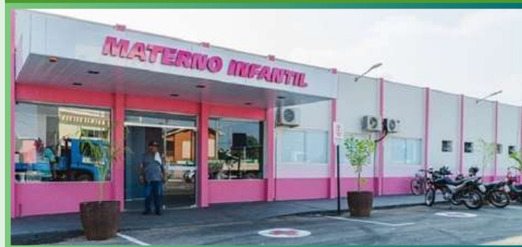
Hospital Materno Infantil