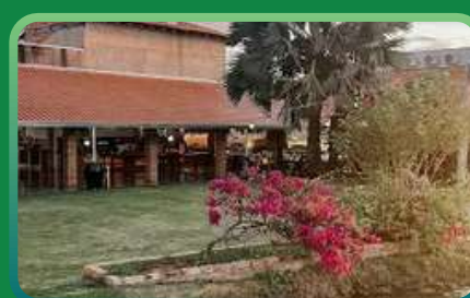
TOCA DO JAVALI